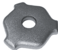
Шайба (поковка) Индекс: рт-120-00-004 Вес: 1,9 кг

* Поглощающий аппарат – компонент автосцепного устройства, служащий для поглощения основной части энергии удара, а также для снижения продольных растягивающих и сжимающих усилий, передающихся через автосцепку на раму рельсового подвижного состава.