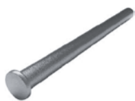
Стержень (поковка) Индекс: рт-120-00-006 Вес: 2,4 кг