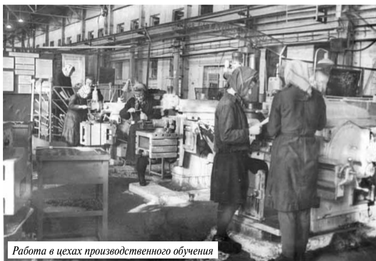
Работа в цехах производственного обучения

«Ходили по заводу с экскурсией. А после знакомства должны были профессию себе выбрать. В нашем классе «А» все были станочниками. Среди «бэшек» – одни повара. Парням заводским на школьниц любо-дорого было смотреть. Встанут, бывало, возле решетки, подбородком упрутся в ладони и подшучивают над нами, молоденькими. Я второй разряд токаря получила. Начиная с 9-го класса и до самого выпуска по полгода на заводе работала. Помню, резцы училась точить. Страшно-то