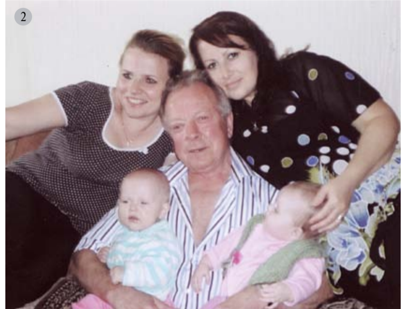
1. С коллегами 2. С дочерьми и младшими внуками 3. С дочкой