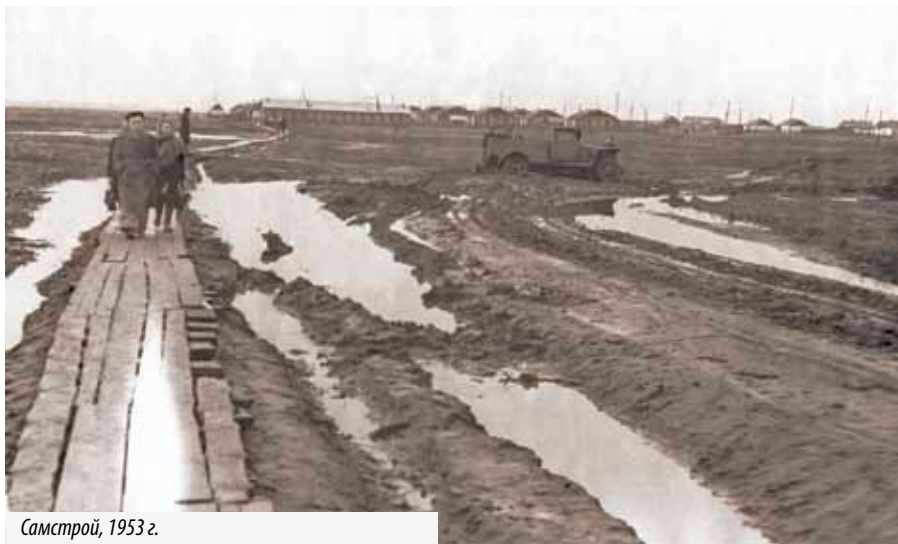
Самстрой, 1953 г.