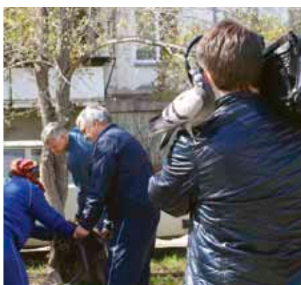
Номинация «Забавный Ленинский»