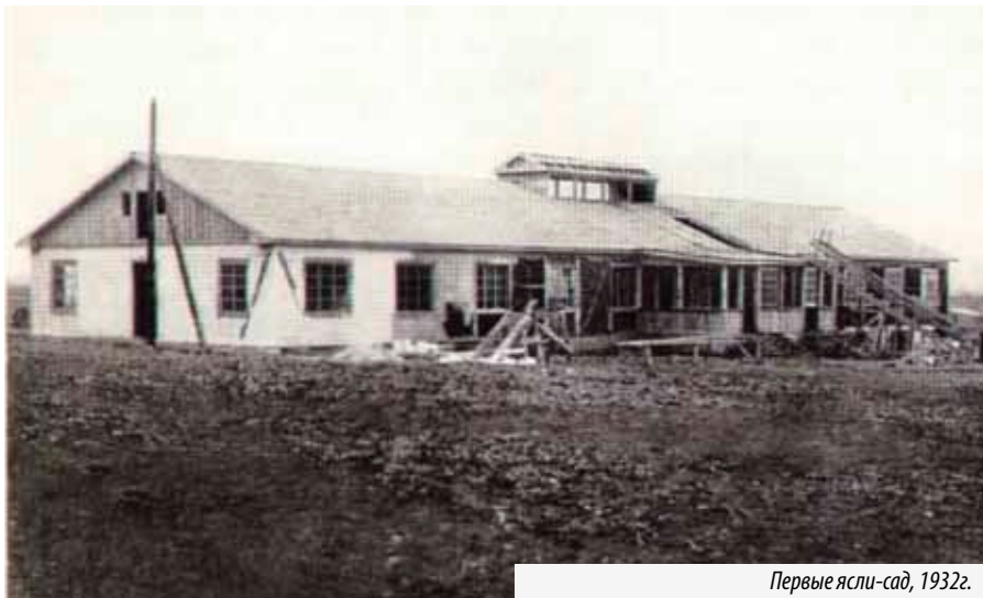
Первые ясли-сад, 1932г.

Авторы: В. Лютов, О. Венрев