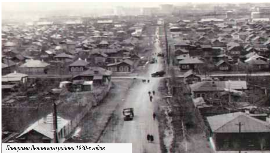
Панорама Ленинского района 1930-х годов