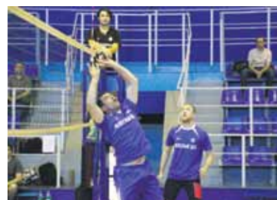
3 место – Колесный цех

А вот по итогам районных соревнований команды ЧКПЗ, увы, не в призёрах. 23 апреля состоялись игры в волейбол в рамках спартакиады Ленинского. От бронзы нашу команду отделяли какие-то несколько очков. У ЧКПЗ в итоге четвертое место.