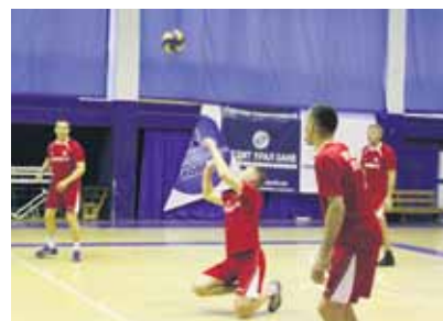
2 место – Кузнечный цех № 2