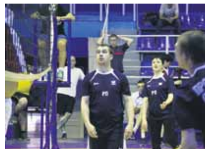
1 место – Ремонтное производство

Не так давно завершился турнир заводской спартакиады по волейболу, в котором кипели нешуточные страсти. Поздравляем лидеров соревнования.