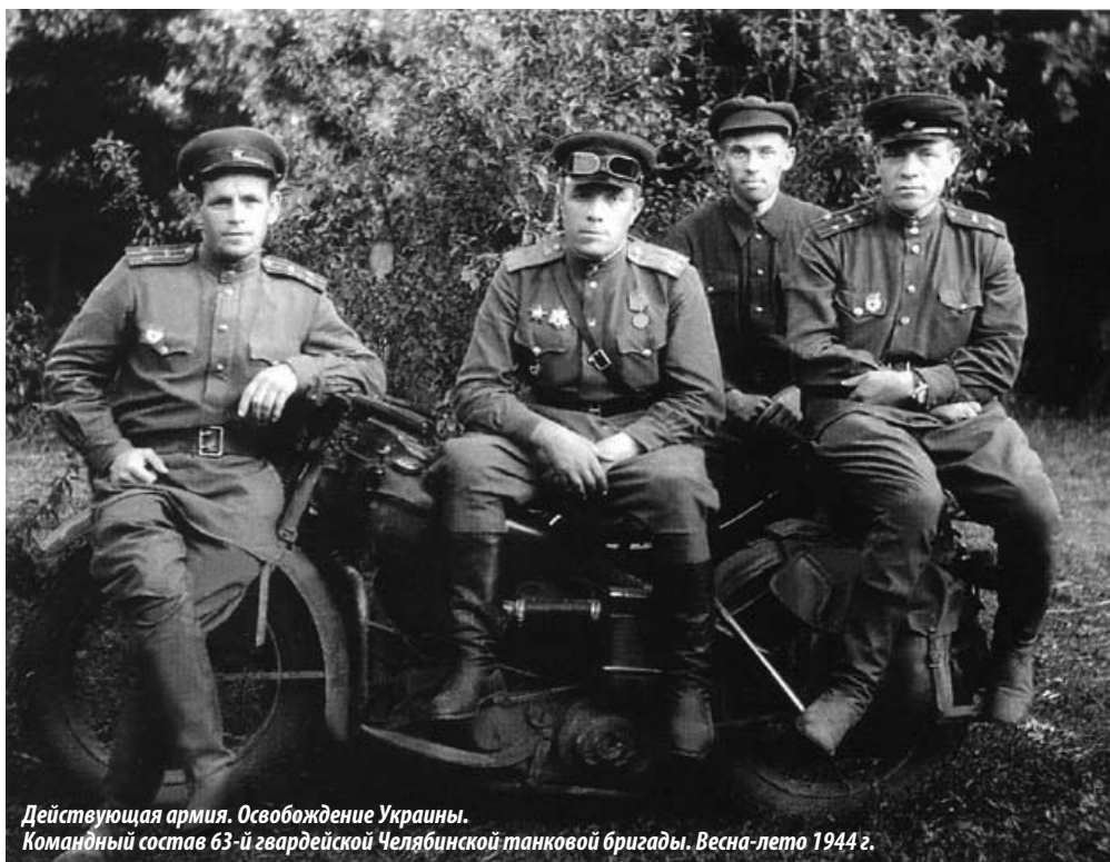
Действующая армия. Освобождение Украины. Командный состав 63-й гвардейской Челябинской танковой бригады. Весна-лето 1944 г.

В составе танковой бригады воевал ее поэт и летописец Михаил Львов. Нельзя не привести отрывок из его дневников о поверженном Берлине: «По улицам бродят немцы – старики и дети, женщины и старухи. На руках у них белые повязки. Вся Германия в белых флагах и повязках. Толпы немецких пленных. Кругом валяется награбленное со всего мира добро – французский хрусталь, наша мебель, ковры со штампом наших артелей и фабрик. Комендант города Мюнхенберг показал нам каслинское литье – чертика, каким-то образом вывезенного в Германию».