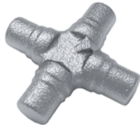
Крестовина карданного вала 469-2201030 Вес: 0,5 кг, сталь: 20Х