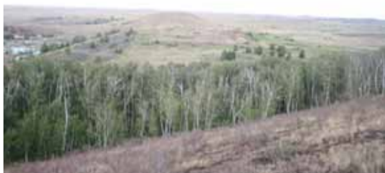
Вид на сопку «Шаманка»