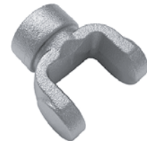
Вилка шлицованная 3160-2203022 Вес: 1,5 кг, сталь: 40