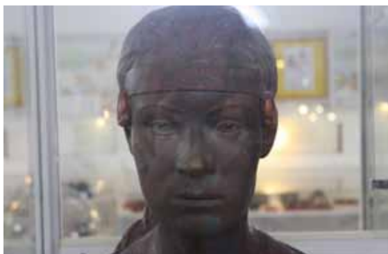
Бюст женщины бронзового века