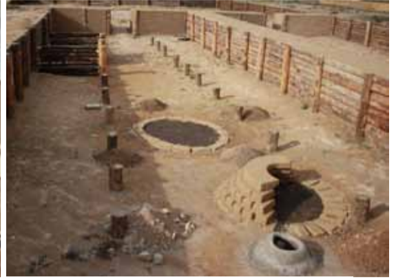
Реконструкция одного из жилищ на месте раскопок

Аркаим манил давно. Хотелось увидеть степь, хотелось живой картинкой древнего городища и живых рассказов, лишенных домыслов и околонуточных знаний. Наконец, хотелось собственных открытий. Удивительно, что уникальный памятник рубежа III–II тыс. до н.э. обнаружен не где-то в Египте или Греции, не в какой-нибудь экзотической Микронезии и не среди библейских камней Ближнего Востока, а здесь, на родной земле Южного Урала.