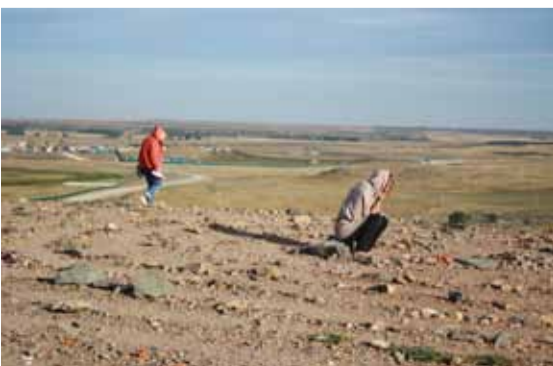
Ритуальная церемония на сопке «Шаманка»