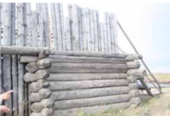
Реконструкция оборонительной стены древнего городища