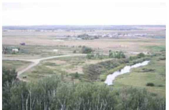
Вид на Аркаимскую долину