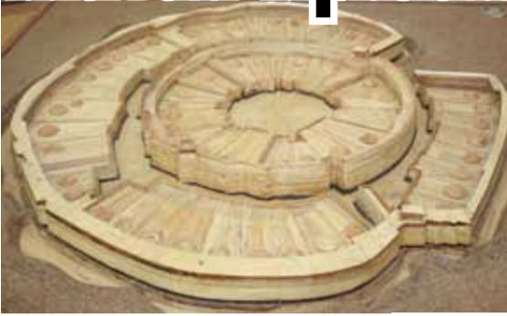
Реконструкция древнего городища