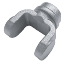
Вилка карданного вала 469-2201022 Вес: 1,3 кг, сталь: 40

Как правильно бороться с безответственной Управляющей компанией – подробная инструкция и последовательность действий