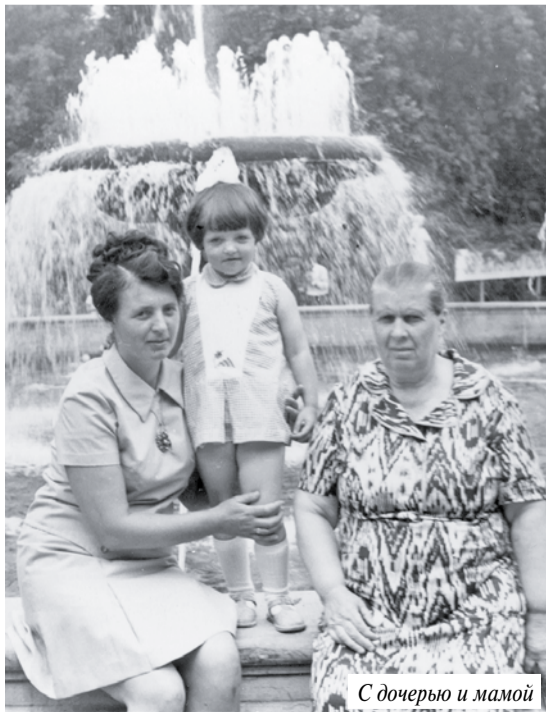
С дочерью и мамой