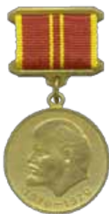
Медаль «За доблестный труд»

Две Благодарности и три Почетные грамоты