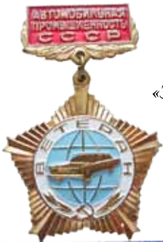
Медаль «Ветеран а втомобильной промышленности»