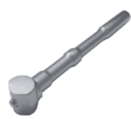
Полуось внутренняя Номер изд.: 5557-2303070-10 Вес: 20,0 кг Марка стали: 20x2н4а