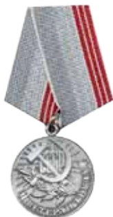
Медаль «Ветеран труда»