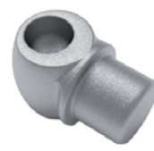
Вилка наружной полуоси Номер изд.: 5557-2303072 Вес: 9,2 кг Марка стали: 12x2н4а

В списке наших заказчиков – новые имена: Knorr Bremse, концерт «Калашников» и другие знаменитые марки.