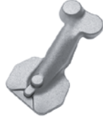
Рычаг поворотного кулака Номер изд.: 4320-2304100 Вес: 7,3 кг Марка стали: 45x