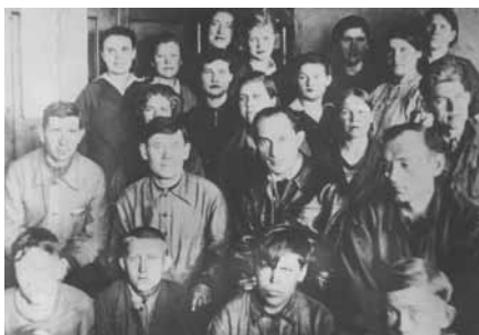
Отдел главного металлурга в 1942 г.

Закончилась война. Страну поднимали на натруженных спинах. Стройки требовали новых мощных автомобилей. Завод получил задание срочно подготовить сложную поковку дизельного коленчатого вала. В короткие сроки была спроектирована оснастка, разработана технология, изготовлены штампы, и Ярославский автомобильный завод получил новый коленчатый вал. Дальше – больше. Лаборатории отдела главного металлурга работают над удешевлением изделий для машины ЗИС-5, над экономией молибдена, повышением стойкости рессор за счёт дробеструйного наклёпа. Да много ли ещё над чем приходилось ломать голову специалистам – стране нужны были грандиозные успехи. Вопросам качества – усиленное внимание. В мае-месяце 1974 года на базе лабораторий разных отделов создается самостоятельное подразделение – центральная заводская лаборатория. Поначалу её сотрудники работали в совершенно непригодных помещениях, разбросанных по всему заводу. Но уже через два года специалистов собра-