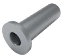
Кожух полуоси Номер изд.: 6361X-2301020 Вес: 46,2 кг Марка стали: 35Хгса