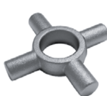
Крестовина дифференциала Номер изд.: 375-2403060 Вес: 2,1 кг Марка стали: 18ХГТ

В 2015 году страна отметит 70-летие великой Победы. К юбилею самого важного праздника «Уральский кузнец» открывает новую рубрику.