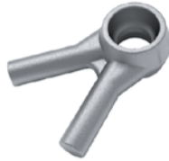
Наконечник Номер изд.: 1500-2919020 Вес: 8,2 кг Марка стали: 40, 35

Нас проверяли целый год. Кто, зачем, и каковы итоги проверок