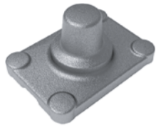
Опора Номер изд.: 1500-2919035 Вес: 4,3 кг Марка стали: 40, 35