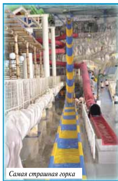
Самая страшная горка