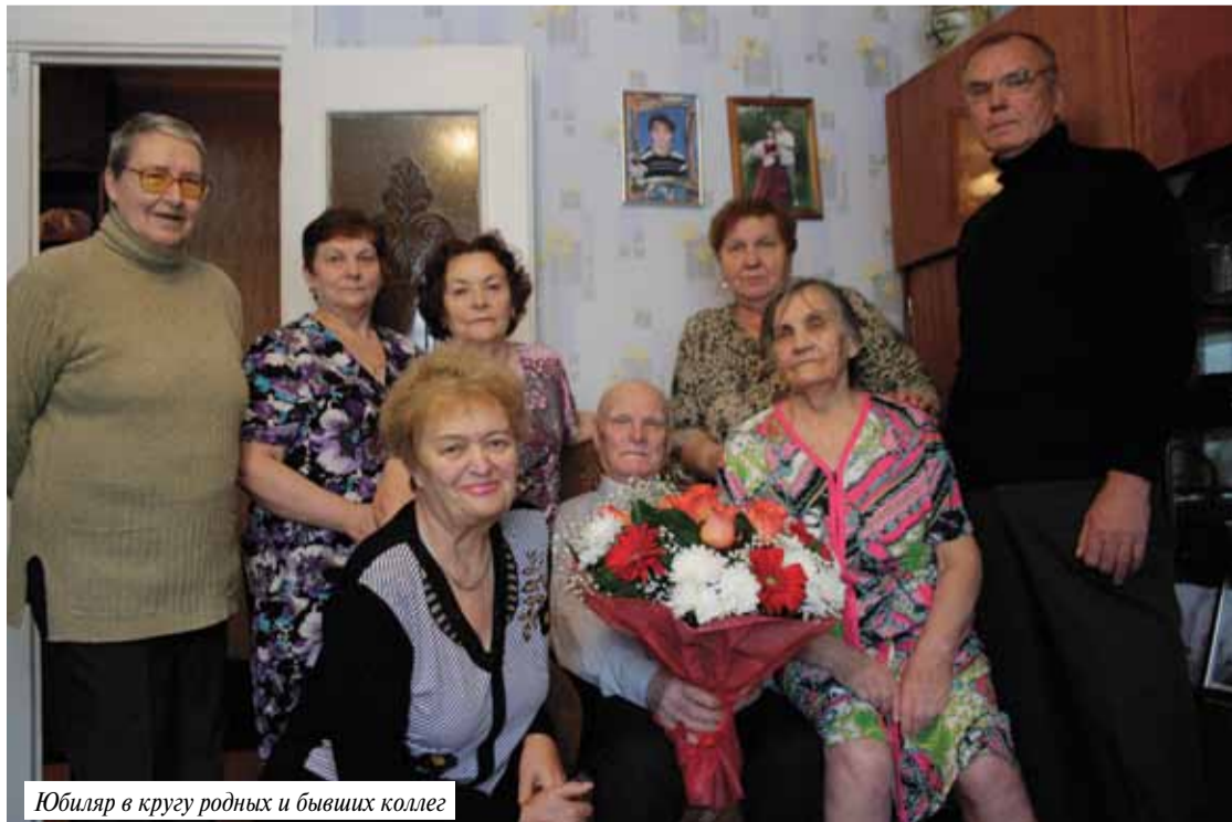
Юбиляр в кругу родных и бывших коллег