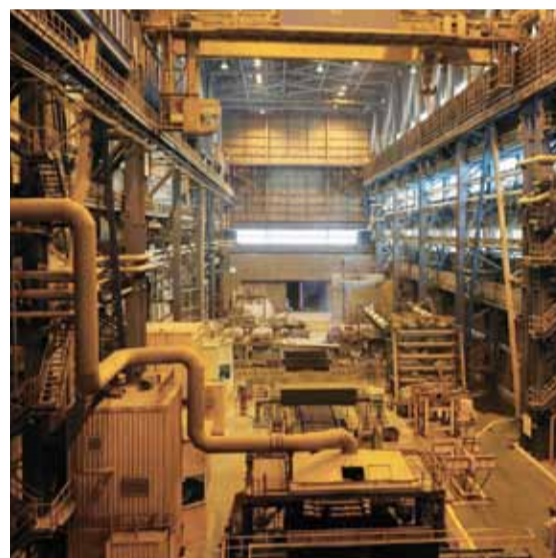
Из доменного цеха горячий металл жидкого чугуна поступает в кислородно-конвертерный цех