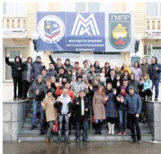
В очередной раз РСМ Челябинской области порадовал интересным мероприятием