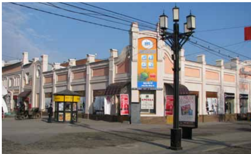
Магазин «Молодежная мода» состоит из двух разных зданий, построенных встык