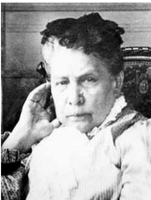
Антониде Ивановне Грибушиной

Торговый дом Валеева, как сказали бы сейчас, – выгодный инвестиционный проект. Здание построено в самом сердце Челябинска – на улице Кирова