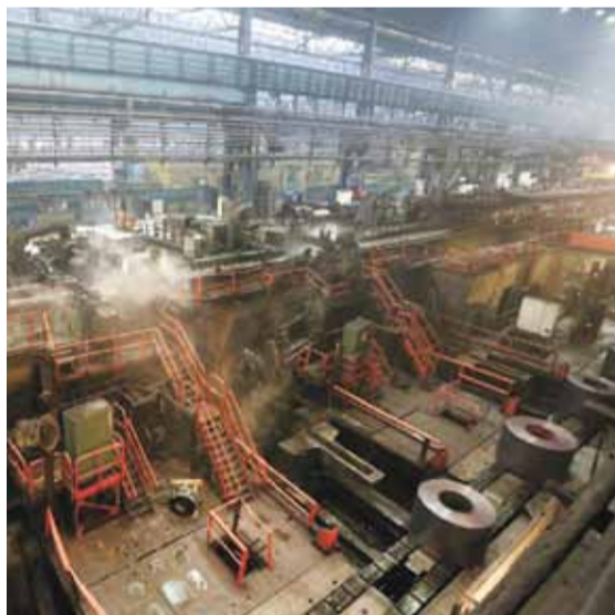
ЛПЦ-10, Стан-2000. В нижней части фото видно рулоны уже свернутого металла