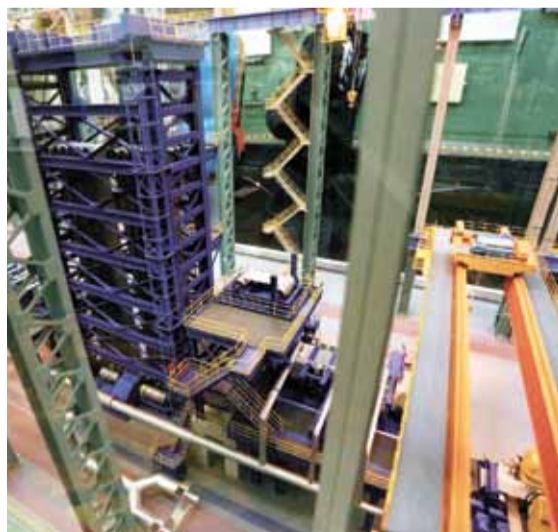
Масштабированный макет Стана-5000. Здесь и ленты едут, и краны движутся