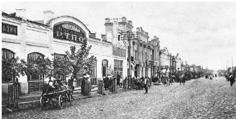
Дом в 1929 году