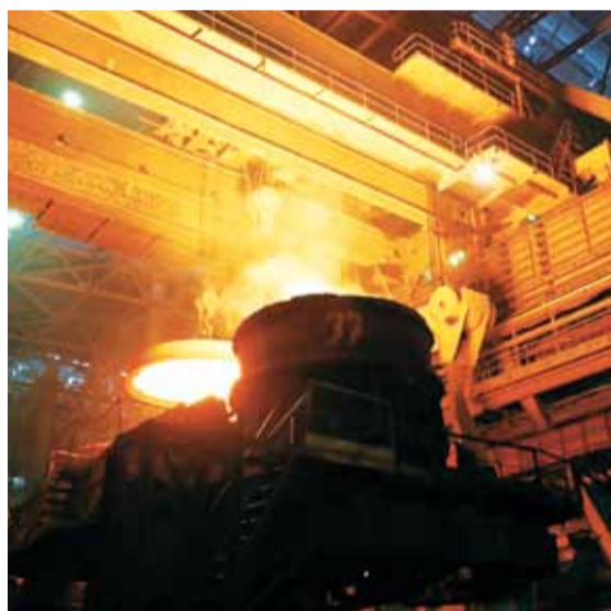
А это собственно печи доменного цеха Магнитогорского комбината