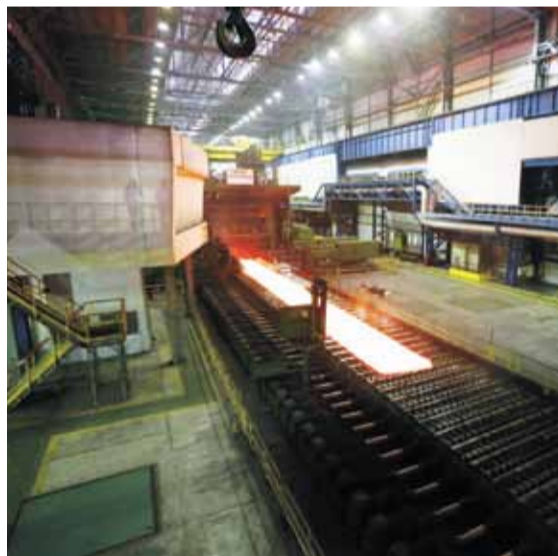
ЛПЦ-9, Стан-5000. Ширина листа до 5 метров, протяженность линии порядка 1,5 км