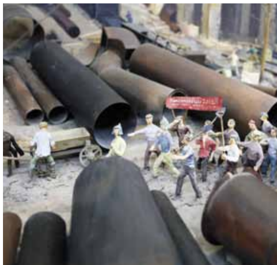
Экспозиция строительства завода в музее. Некоторые фигурки даже двигаются