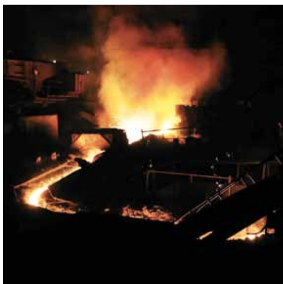
В цехе доменной плавки. Вот где в буквальном смысле плавят металл