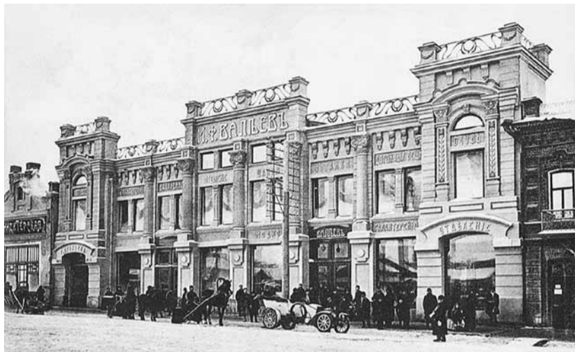
Торговый дом Валеева