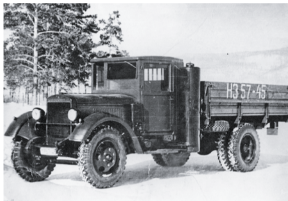
Урал ЗИС-355 с газогенераторной установкой