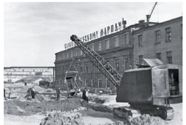
Первый колесный цех с пристроем (послевоенное фото)