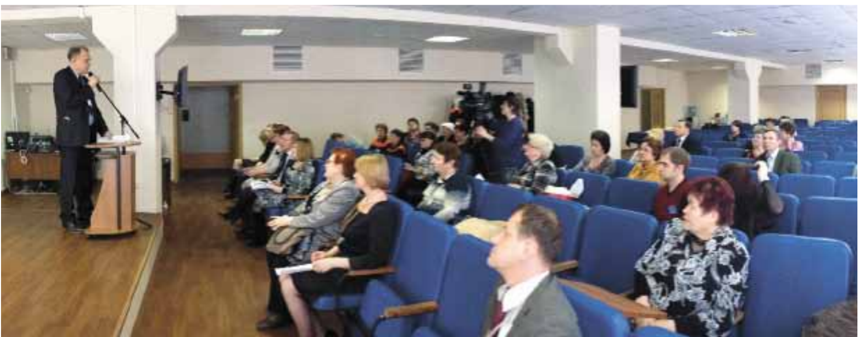
О чем говорили и спорили участники сессии, каким был итог встречи, вы узнаете из следующего номера «УК».