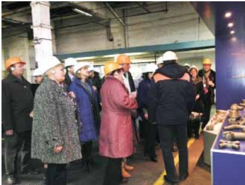
Экскурсия прошла по короткому маршруту. Будучи ограниченными во времени, гости успели посетить лишь колесный и второй кузнечный цеха.