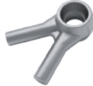
Наконечник Номер изд.: 1500-2919020 Вес: 8,2 кг Марка стали: 40, 35

Вашему ребенку от 7 до 10 лет, и он любит рисовать? Тогда начинайте творить на тему «Моя дорога безопасная», скоро мы расскажем, куда нести рисунки на конкурс ГИБДД.