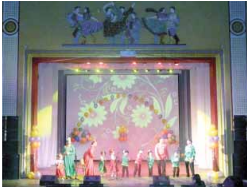
Задорную Кадриль сыграл коллектив «Балалаечка», состоящий из воспитанников МДОУ № 320 и их родителей