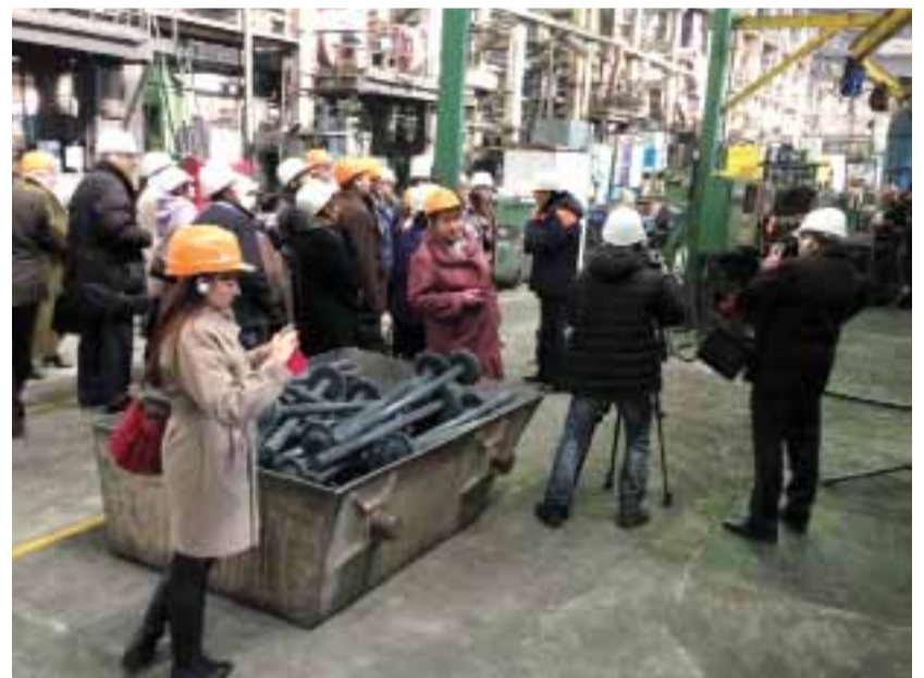
Куриной. Выслушав их, гости пришли к единогласному мнению, что у ЧКПЗ есть чему поучиться многим российским предприятиям.