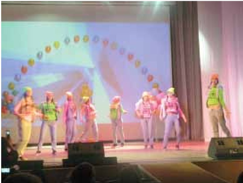
Ученицы школы-интерната № 9 подготовили выступление в жанре современного уличного танца

ками одиннадцати образовательных учреждений. Выставка работала в течение часа, после чего начался концерт. В программу вошли 19 групповых и сольных выступлений в разных жанрах. Танцы, песни, музыка, стихи, проза — от русских народных и классики до эстрады и андерграунда.