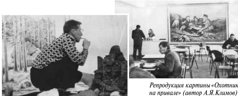
Репродукция картины «Охотники на привале» (автор А.Я.Климов)