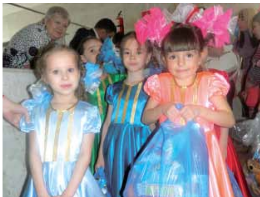
Подарки от партнёров фестиваля получили все участники