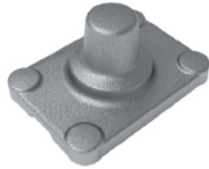
Опора Номер изд.: 1500-2919035 Вес: 4,3 кг Марка стали: 40, 35