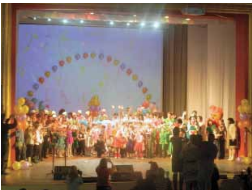
На прощанье все юные дарования собрались на сцене для группового фото