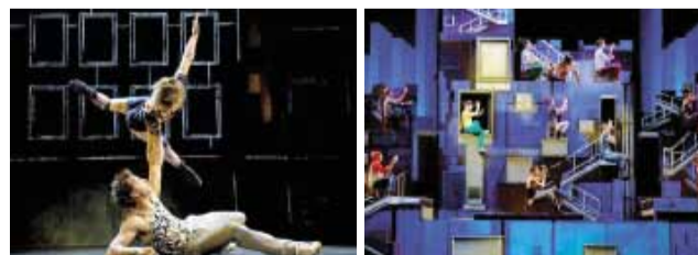
Обзор подготовила Юлия ПОПОВА

А на ледовой арене трактор с 19 по 22 ноября – CIRQUE ELOIZE ID от легендарного Du Soleil, рекомендуем приобрести билеты заранее – самые дешевые по 1000 р. почти все проданы, места по цене от 2000 до 3000 р. пока есть на все сеансы (на пт и сб 2200-3200 р.). Не дешево, но поверьте – хотя бы однажды на Du Soleil сходить нужно!