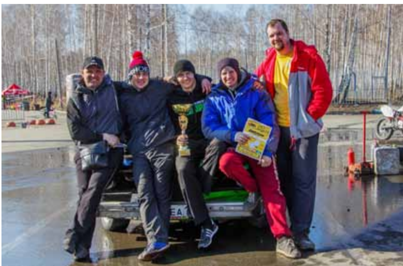
Счастливого победителя (в центре) с друзьями и товарищами по команде