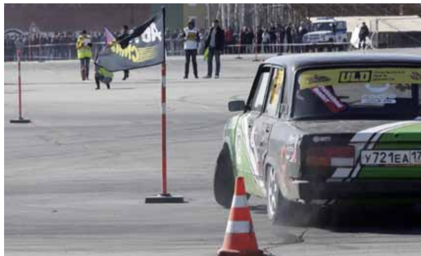
В заносе обитие контрольную точку и не задеть так близко стоящие конусы – в этом прелесть джимканы