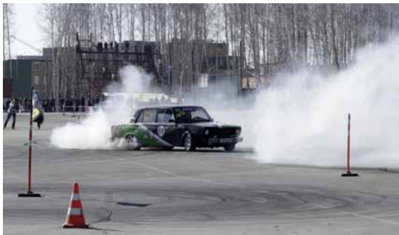
Как не устроить красивый показательный дрифт, когда ты выиграл гонку

КУЛЬТУРНО-ДОСУГОВЫЙ ЦЕНТР ОАО «ЧКПЗ» ПРИГЛАШАЕТ