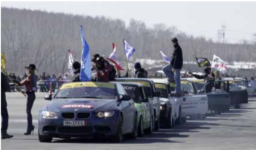
На равных борются за победу ВАЗы, BMW, японские иномарки, главное условие – задний привод